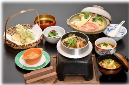
⑭山菜、きのこなど店主が採取