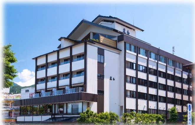
上諏訪温泉で唯一、「朱」と「白」二色の温泉を楽しめます 最上階の露天風呂からは諏訪湖を一望できます