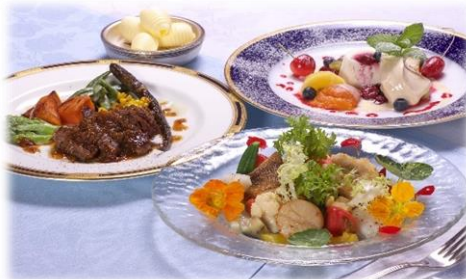
⑧フレンチコースランチ