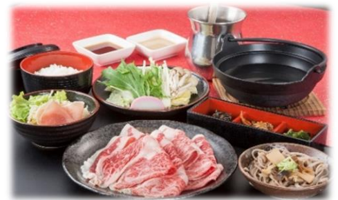
㉔信州和牛しゃぶしゃぶ