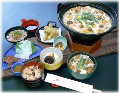
①名物「田舎きのこ汁」