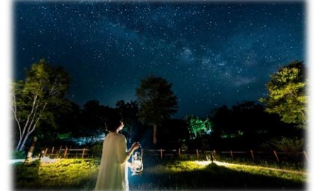
㉗日本一の星空ナイトツアー