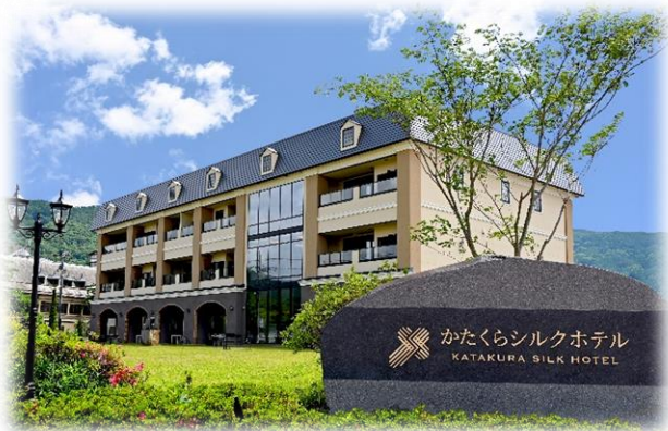
湖畔の洋館 かたくらシルクホテル (旧諏訪湖ホテル) 2021年4月新築オープン 全室露天風呂付客室