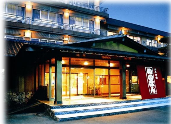
江戸時代より続く創業160年余年の伝統ある日本旅館 夢屋敷の客室からは諏訪湖を一望できます