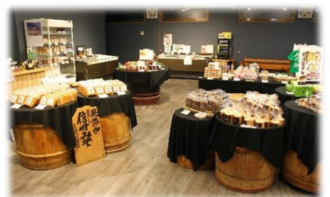
⑨味噌工場 お土産売り場