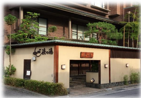
大正時代から湧き続く源泉は自家源泉かけ流し 湯上りにはお肌がつるつるの美肌の湯