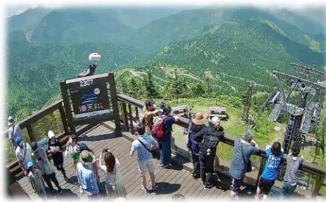
⑪満天ビューテラス