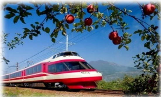
ゆけむり号 ワインバレー列車