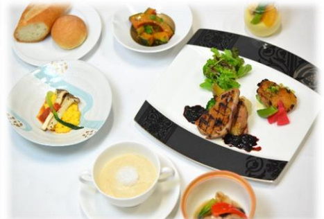
⑥洋食コースランチ