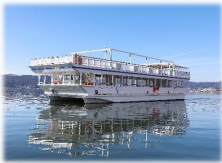
⑱スワロスターマイン号