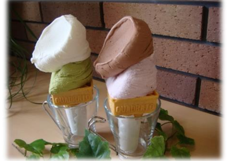
③オリジナルジェラート