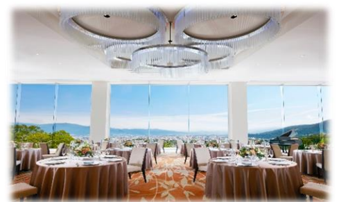
⑮善光寺平を一望する会場