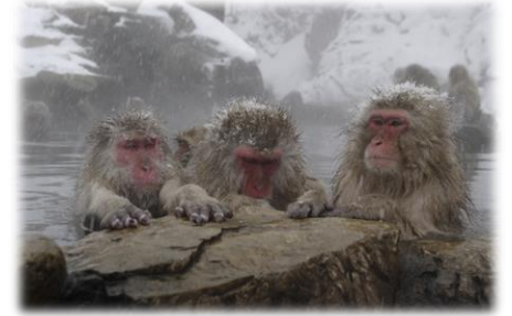
⑫スノーモンキー 冬季