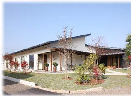
⑳トコロテラス 全景