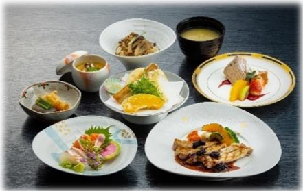
⑦和食ランチ「上田御膳」